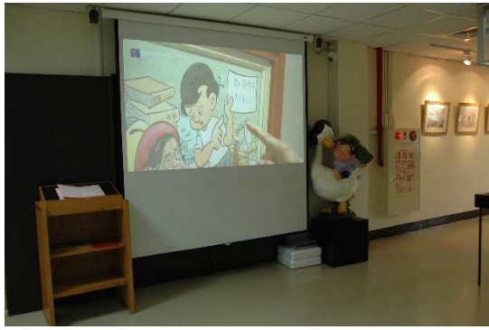
中心藝廊外投影布幕